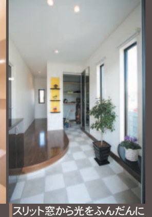
スリット窓から光をふんだんに取り入れた明るい玄関、たっぷり収納可能