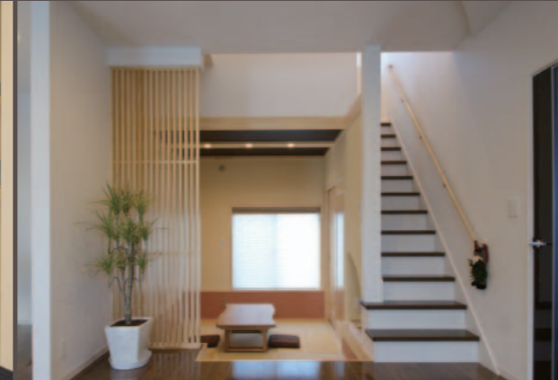
落ち着いた雰囲気を演出した段下りの和室