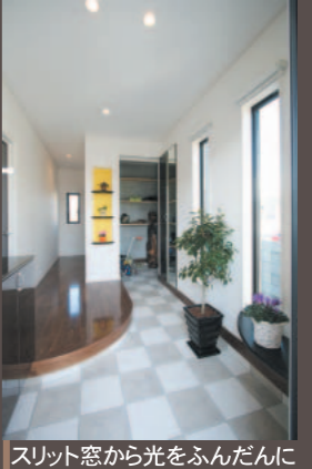
スリット窓から光をふんだんに取り入れた明るい玄関、たっぷり収納可能