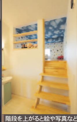
階段を上がると絵や写真などを展示、家族のギャラリースペース「思い出ポケット」