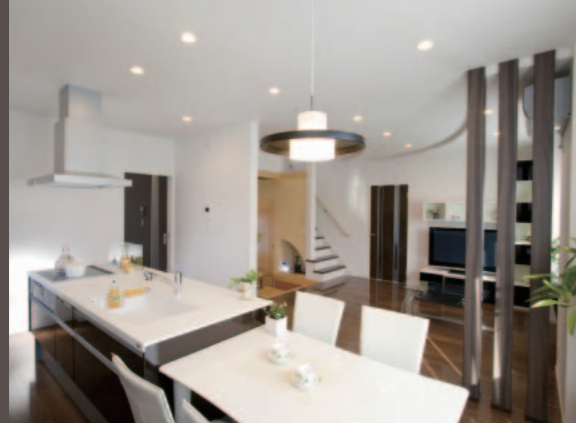
家族が触れ合い、料理をしながら会話を楽しめる開放的なアイランド・キッチン