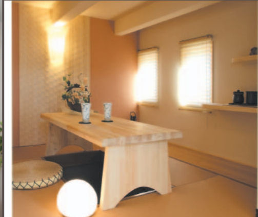
夫婦二人だけのリラックス空間「カフェテリア」のある寝室