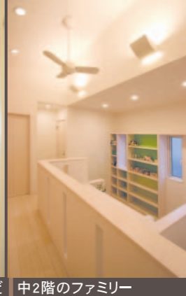
中2階のファミリーライブラリー&書斎、採光・収納力が魅力