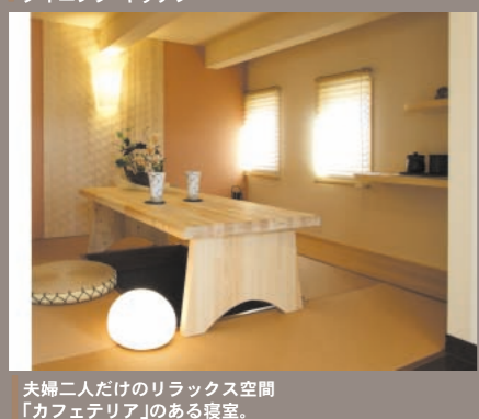
夫婦二人だけのリラックス空間 「カフェテリア」のある寝室。