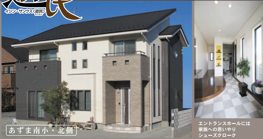
あずま南小・北側