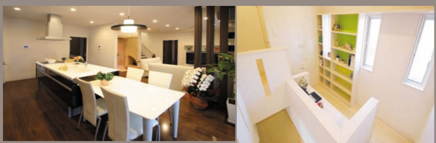
家族が触れ合い、料理をしながら会話を楽しめる開放的な ダイニング・キッチン