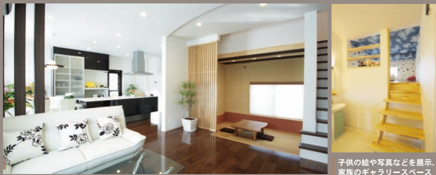
親子のコミュニケーションがしかりはかれる、一体型オープンフロアのLDK